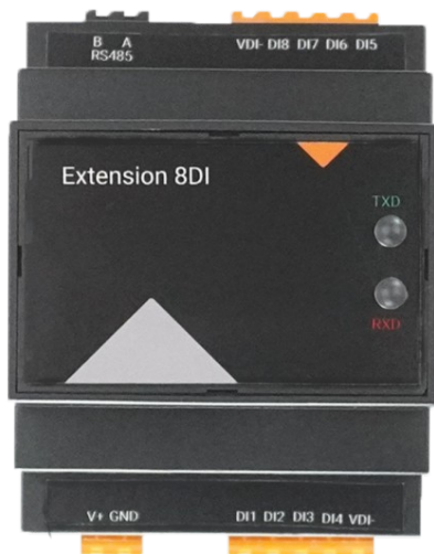
Abbildung 1: CommU Extension 8DI